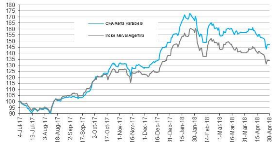
Evolución de la cuota parte B frente a Índice Merval Argentina