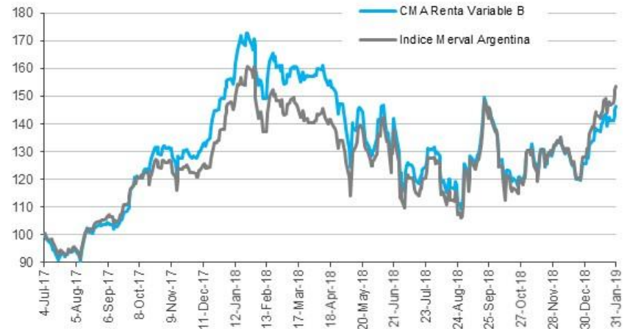
Evolución de la cuota parte B frente a Índice Merval Argentina