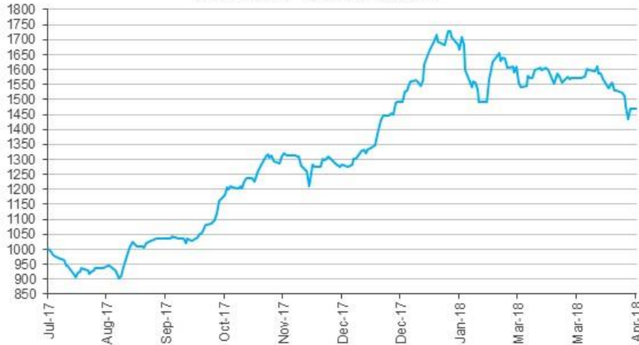
Evolución de la cuota Parte CMA Renta Variable Clase B