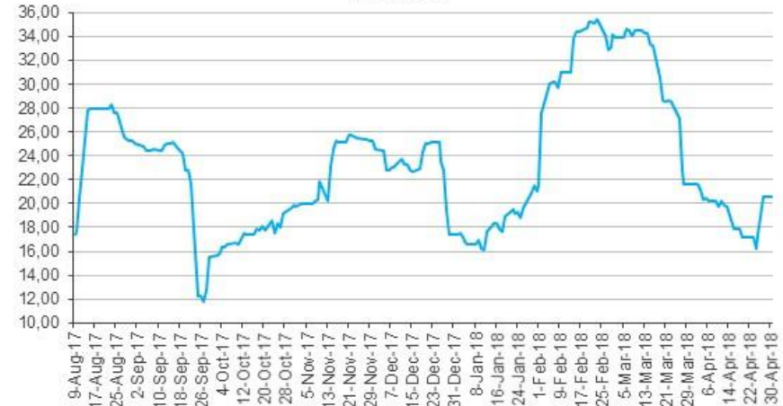
CMA Renta Variable Volatilidad