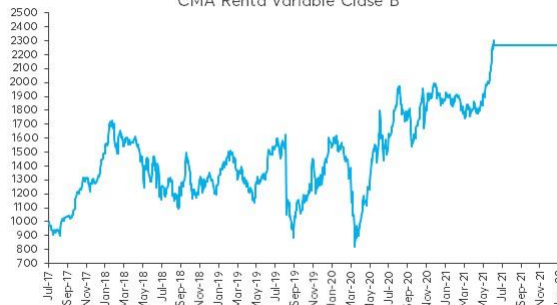
Evolución de la cuota Parte CMA Renta Variable Clase B