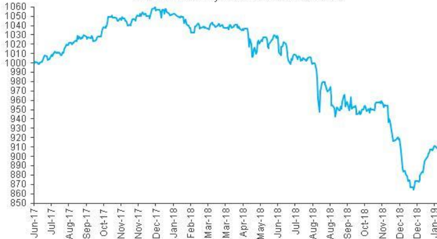
Evolución de la cuota Parte CMA Renta Fija en Dólares Clase B