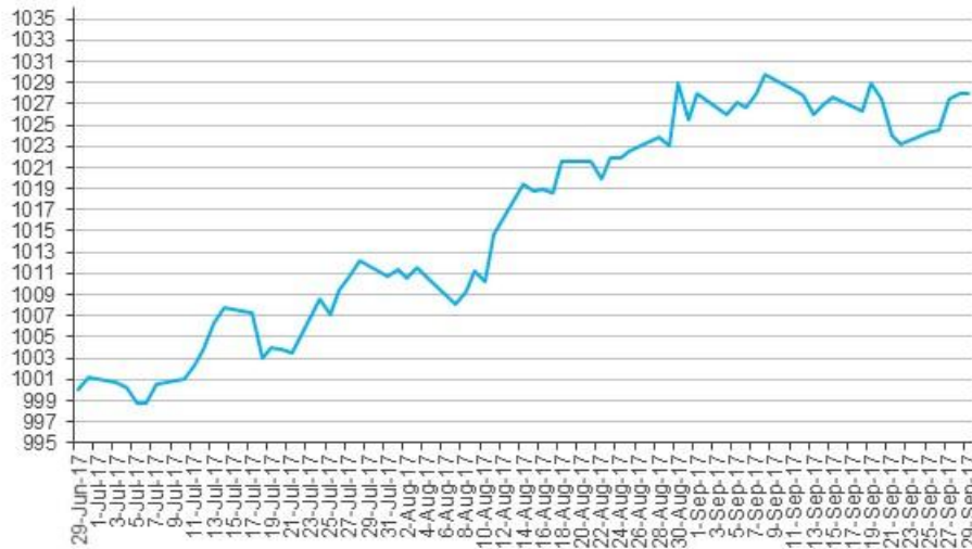
Evolución de la cuota Parte CMA Renta Fija en Dólares Clase B