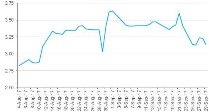
CMA Renta Fija en Dólares Volatilidad