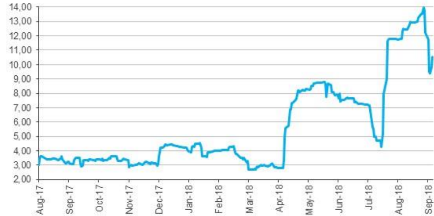
CMA Renta Fija en Dólares Volatilidad