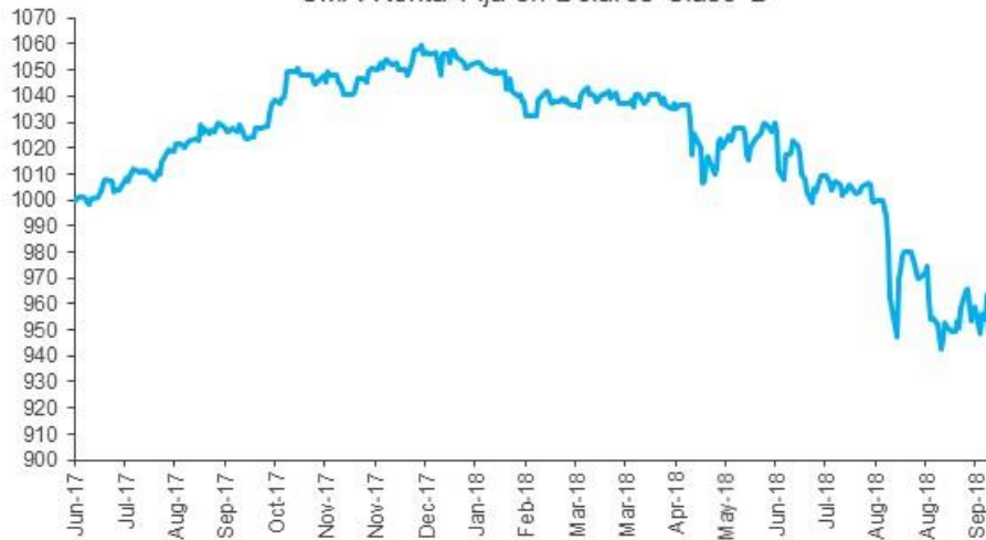
Evolución de la cuota Parte CMA Renta Fija en Dólares Clase B