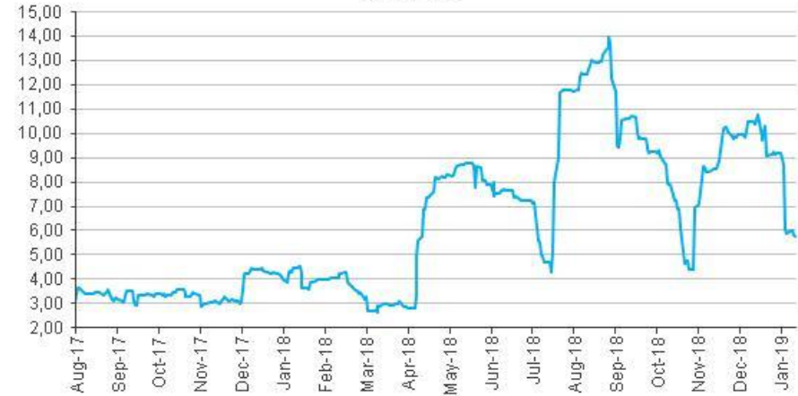
CMA Renta Fija en Dólares Volatilidad