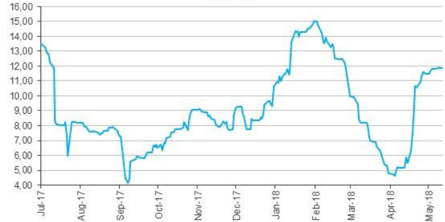
CMA Crecimiento Volatilidad