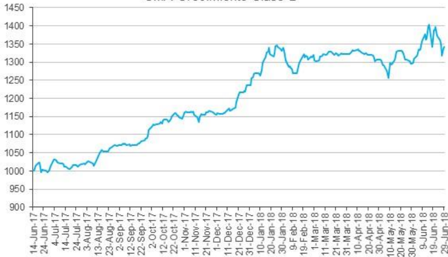
Evolución de la cuota Parte CMA Crecimiento Clase B