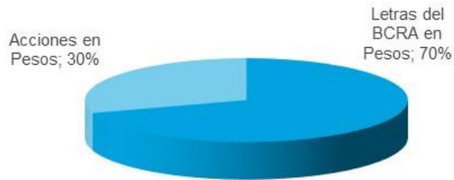
Composición de la Cartera al 28-Mar-18