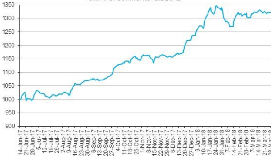
Evolución de la cuota Parte CMA Crecimiento Clase B