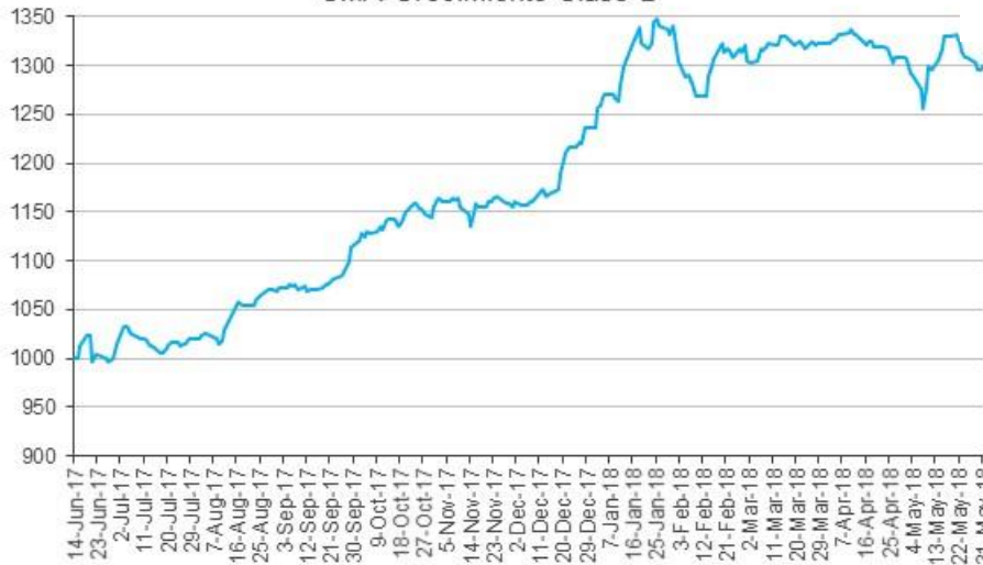
Evolución de la cuota Parte CMA Crecimiento Clase B