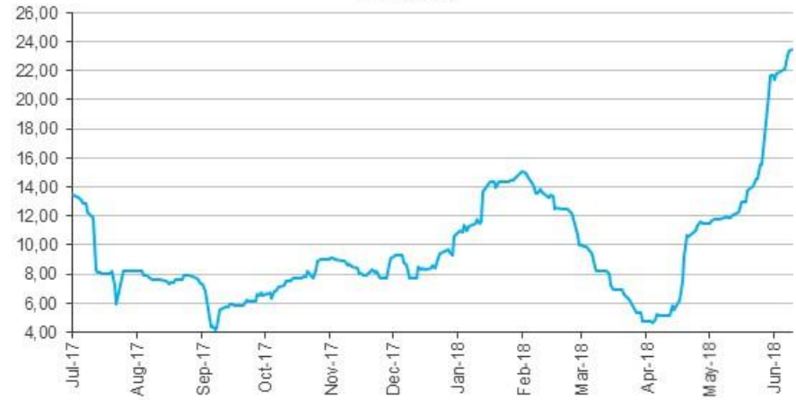
CMA Crecimiento Volatilidad