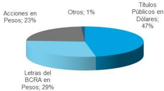
Composición de la Cartera al 29-Jun-18